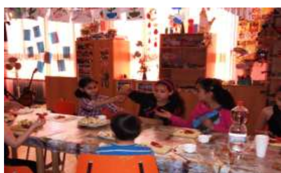
Komunitní centrum pro děti a mládež Kamarád Děčín - Boletice nad Labem