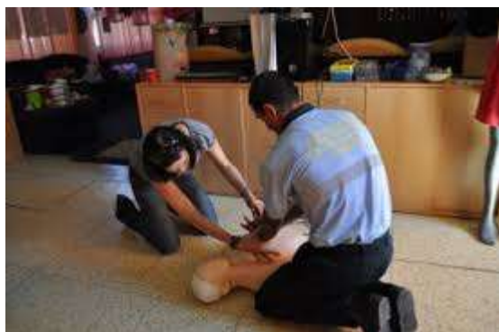
Kurz první pomoci pro APK