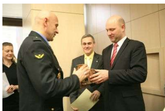
Přebírání ceny prevence kriminality