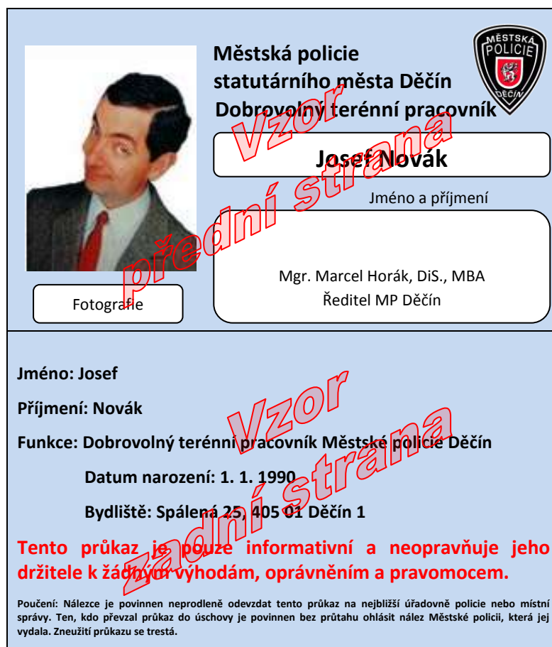
Vzor průkazu dobrovolného terénního pracovníka

V neposlední řadě tito dobrovolní terénní pracovníci mohou být personálním zdrojem při případném dalším hledání nových vhodných kandidátů na pozici APK.