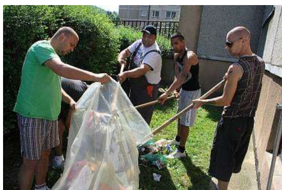
Pomoc APK při úklidu ve volném čase