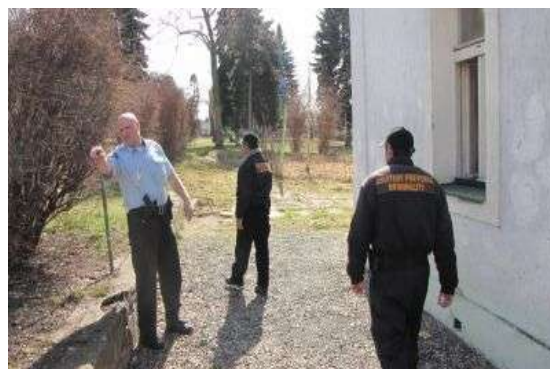
Kontrola problémového domu