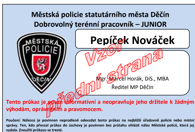
Vzor průkazu dobrovolného terénního pracovníka - Juniora