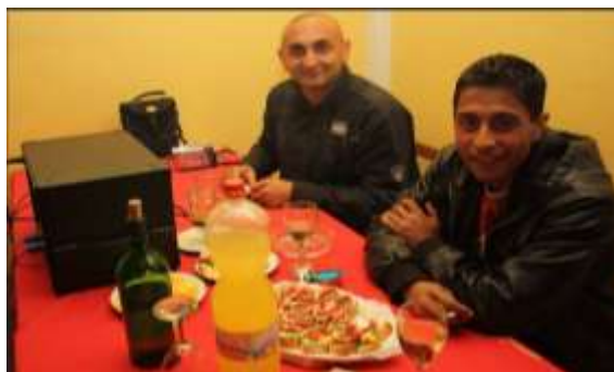
Romská zábava pořádaná APK Děčín