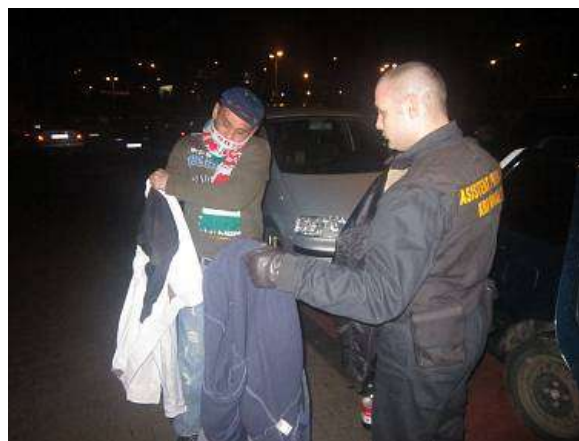
Strážníci MP Děčín a APK Děčín v akci