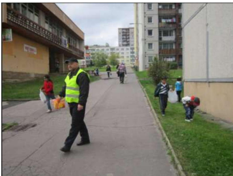
Dobrovolní terénní pracovníci MP Děčín v terénu