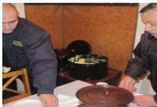
Akce APK zaměřená na bezdomovce